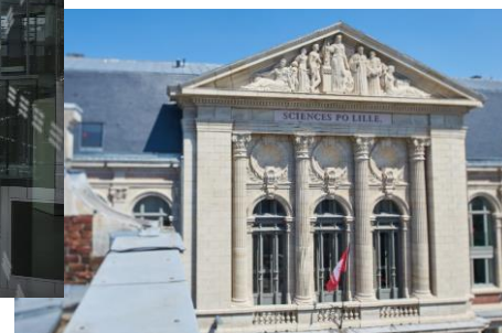
Site de Sciences Po Lille